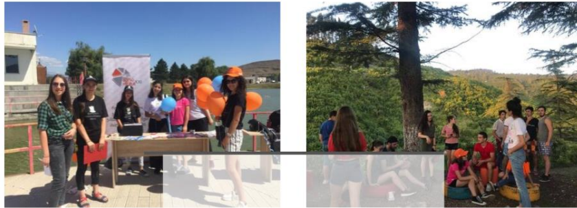
ახალგაზრდების საერთაშორისო დღე