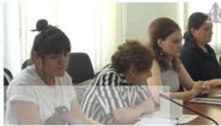
“ჰერა XXI“-ს შეხვედრა მარნეულის მუნიციპალიტეტის გენდერული თანასწორობის საბჭოს წარმომადგენლებთან