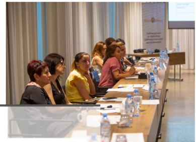
სემინარი საქსუალური და რეპროდუქციული ჯანმრთელობის და უფლებების, გენდერული თანასწორობის ძირითადი პრინციპების შესახებ