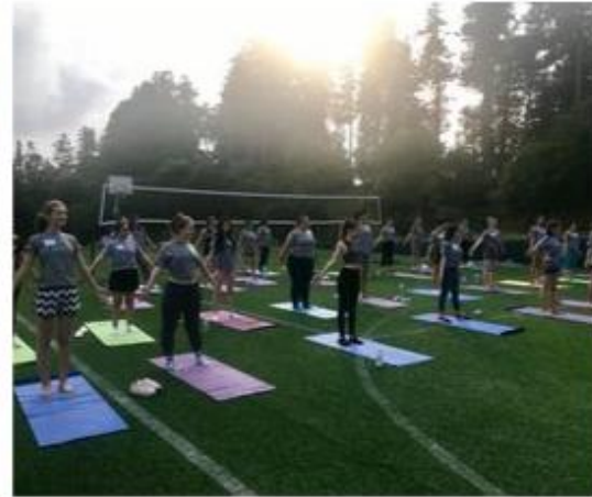
საგაფხულო ბანაკი გოგონებისთვის – SELF CAMP