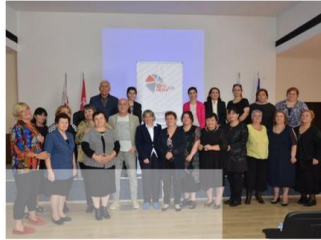
ტრენინგი სოფლის ექიმებისთვის