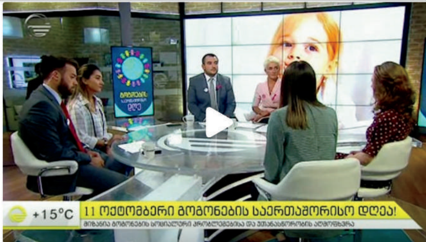
+15°C 11 ოქტომბერი გოგონების საერთაშორისო დღეა! მონაწილეობენ სოციალური პოლიტიკისა და ადამიანთა რესურსების განვითარების