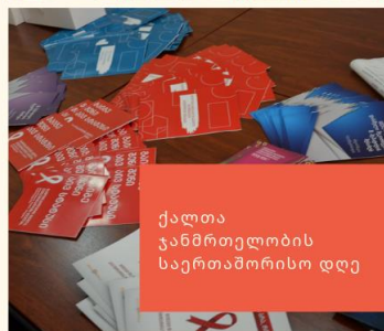
ქალთა ჯანმრთელობის საერთაშორისო დღე

მთელი მსოფლიოს მასშტაბით, 28 მაისს ქალთა ჯანმრთელობის საერთაშორისო დღე აღინიშნება. წელს, ამ დღესთან დაკავშირებით, ასოციაცია "ჰერა XXI"-გასვლითი შეხვედრით ესტურმა სოფლად მცხოვრებ, მოწყვლად ჯგუფებს და ბოლნისის მუნიციპალიტეტის ქალთა ოთახთან თანამშრომლობით მოსახლეობას შესთავაზა უფასო ტესტირება აივ ინფექცია/შიდსზე, B და C ჰეპატიტებსა და სიფილისზე.