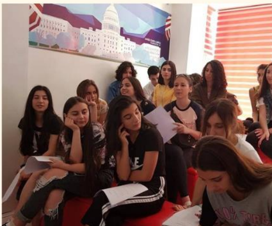
კლუბი "ჯანსაღი ცხოვრების წესი"

2019 წელს, ასოციაცია „ჰერა XXI“-ამ დაიწყო თანამშრომლობა რუსთავის ამერიკულ კუთხესთან, რის ფარგლებშიც, ორგანიზაციის ახალგაზრდულმა ჯგუფმა დაარსა კლუბი "ჯანსაღი ცხოვრების წესი". კლუბის ფარგლებში დაიგეგმა 4 საინფორმაციო სესია რომელთა მიზანი იყო ახალგაზრდებში ჯანსაღი ცხოვრების წესის პოპულარიზაცია და მათი ცნობიერების გაზრდა სექსუალური და რეპროდუქციული ჯანმრთელობისა და უფლებების შესახებ. საინფორმაციო შეხვედრებს ასოციაცია "ჰერა XXI"-ს შერჩეული თანასწორგანმანათლებლები ატარებდნენ. ამ გზით, ახალგაზრდებმა ინფორმაცია მათთვის გასაგებ და მისაღებ ენაზე თანატოლებისგან მიიღეს.